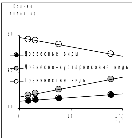
Рис. 2. Линейные тренды по данным 1944–1981 гг.

Высокая достоверность аппроксимации предполагает наличие тесной взаимосвязи между долями групп жизненных форм. По данным 1944–1981 гг. эта взаимосвязь представима в виде: