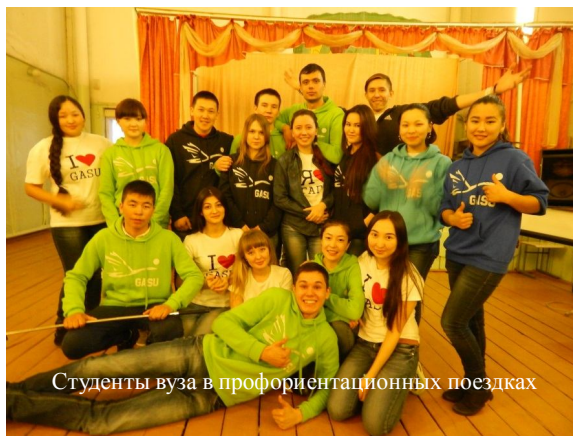
Студенты вуза в профориентационных поездках

ансамбля «Любава», певцы, в общем, разные творческие личности университета. Работниками центра социально-психологической помощи ГАГУ активно проводится тестирование по определению профессиональной направленности школьников. В этом году такое тес-