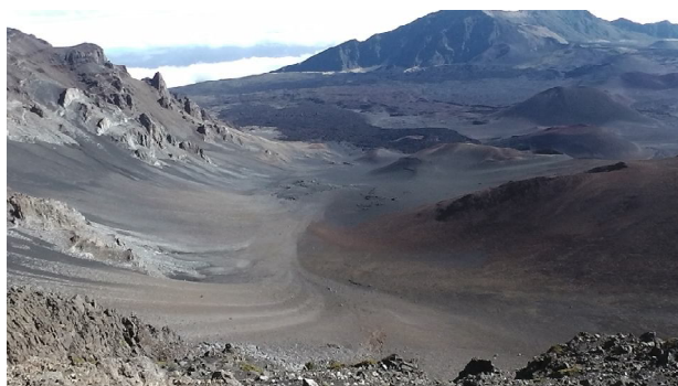
Кратер вулкана Халеакала

Для возрождения острова была создана Комиссия по сохранению острова Кахоолави (Kahoowawe Island Reserve Commission, KIRC). Эта организация реализует ряд программ, в первую очередь