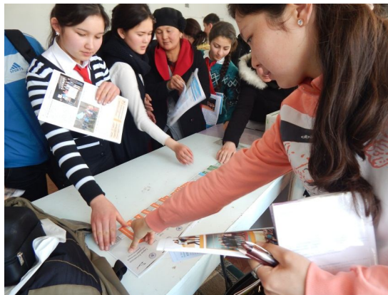
Таласская область. Школьники разбирают буклеты университета

Ещё одним ярким событием этого года стала профориентационная поезд-