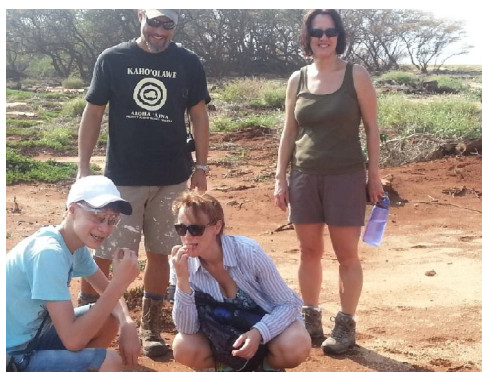
Подножный корм о. Кахоолаве