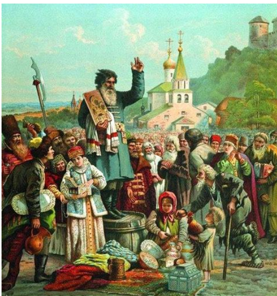
Воззвание Козмы Минина к нижегородцам. Событие 1611 года