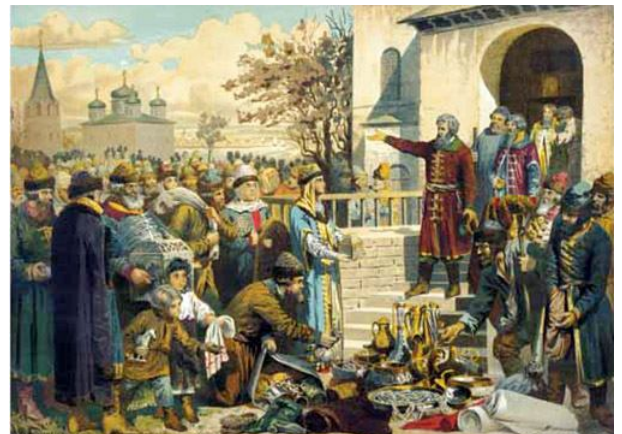
Воззвание Козмы Минина к нижегородцам. Событие 1611 года Художник - Алексей Кившенко.

обогащаться любой ценой, нигилизм – это те явления, с которых начинается разложение государства и вырождение нации. По подсчетам историков, за годы Смуты в России объявилось семнадцать самозванцев. Двое из них оказались наиболее опасными: Лжедмитрий I захватил власть и 11 месяцев сумел усидеть на троне, Лжедмитрий II почти два года осаждал Москву и остался в истории нашего государства как Тушинский вор. На защиту страны выступили «основные люди», те самые, об отсутствии которых писали либералы.