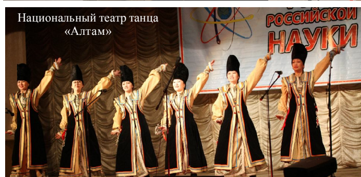
Национальный театр танца «Алтай»