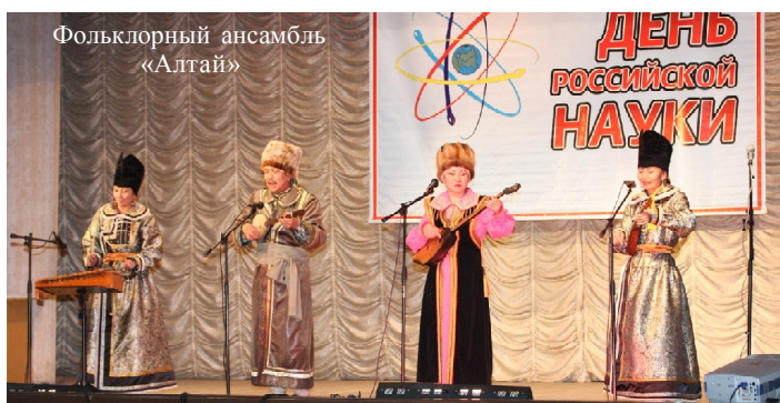
Фольклорный ансамбль «Алтай»