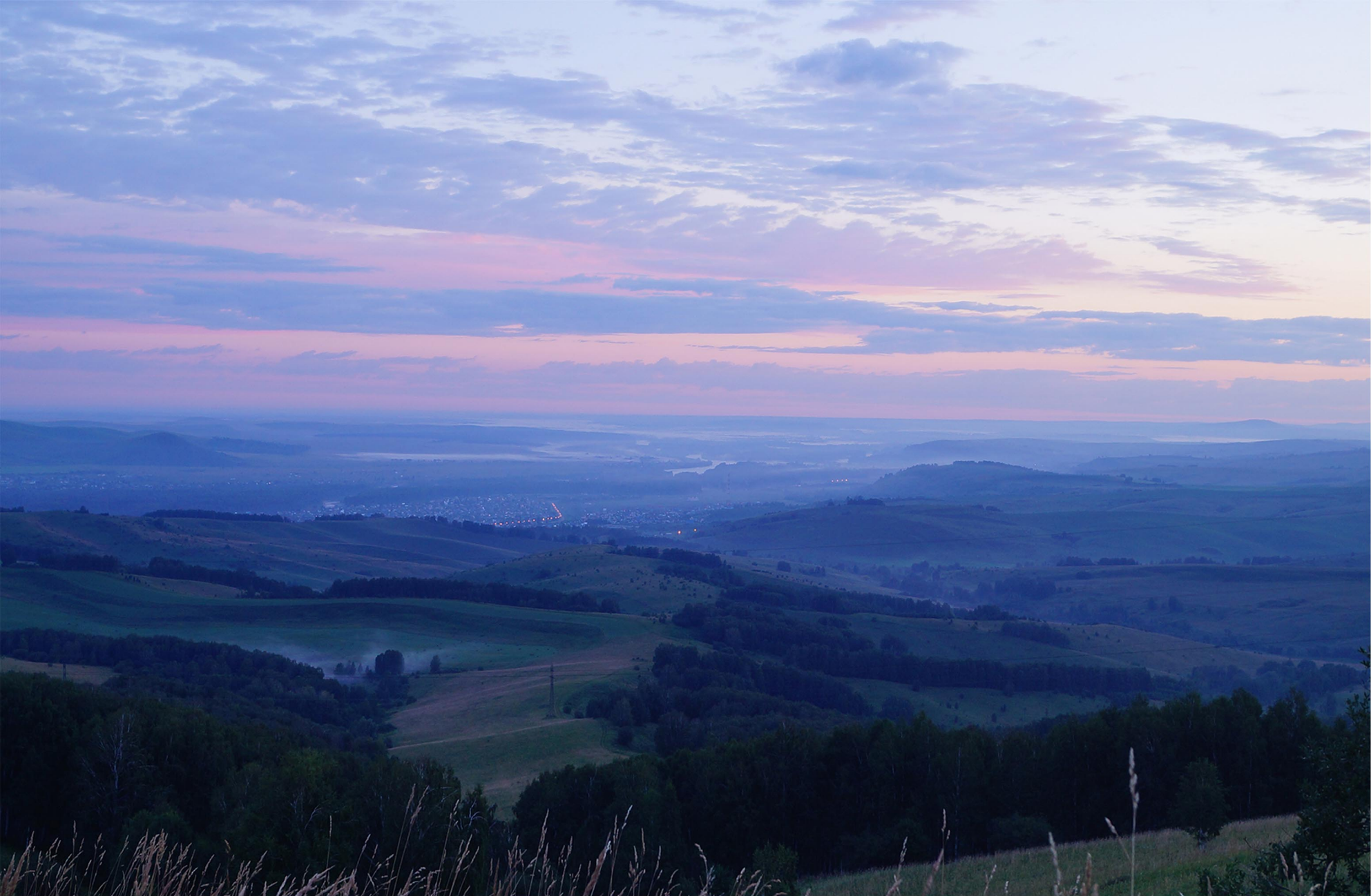
Фото-/ видеоальбом Владимира Чащина «Мечта, это лишь начало» вы можете посмотреть ВКонтакте: vk.com/public73349129