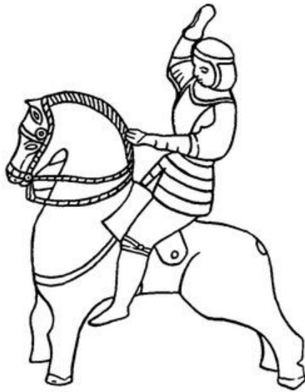
Рис 2. Статуэтка конного рыцаря из Аблай-кита в Верхнем Прииртышье